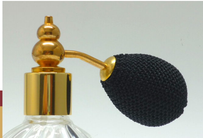
Tête / Head / Kopf : 07