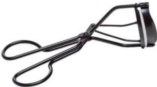
WIMPERNFORMER, SCHWARZ, NICKELFREI EYELASH CURLER, BLACK, NICKEL-FREE RECOURBE CILS, NOIR, SANS NICKEL Art.-Nr / No: 2701020 Größe / Size / Dimensions: ca. 10 cm EP / PP / PA: € 1,60