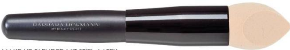
MAKE-UP BLENDER MIT STIEL, LATEX MAKE-UP BLENDER WITH HANDLE, LATEX MAKE-UP BLENDER AVEC MANCHE, LATEX Art.-Nr / No: 1350273 VEGAN Größe / Size / Dimensions: ca. 17 cm EP / PP / PA: € 4,19