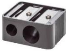
KOSMETIKSTIFT-SPITZER, DOPPELT COSMETIC PENCIL SHARPENER, DOUBLE TAILLE-CRAYON, DOUBLE Art.-Nr / No: 1202020 EP / PP / PA: € 0,85