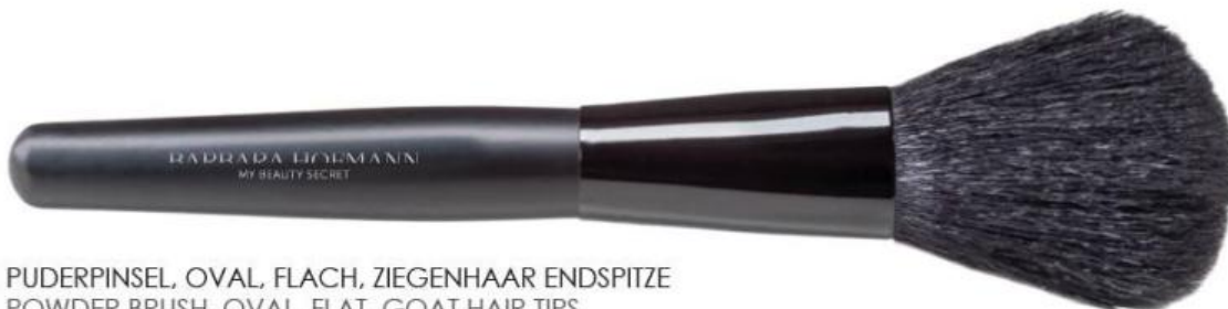
PUDERPINSEL, OVAL, FLACH, ZIEGENHAAR ENDSPITZE POWDER BRUSH, OVAL, FLAT, GOAT HAIR TIPS PINCEAU POUVRE, OVALE, PLAT, POILS DE CHÈVRE AVEC POINTES FINES Art.-Nr / No: 0233270 Größe / Size / Dimensions: ca. 18,5 cm EP / PP / PA: € 4,85