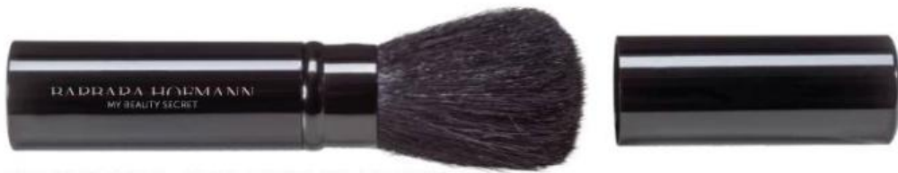
TASCHENPINSEL, OVAL, RUND, SYNTHETIKHAAR RETRACTABLE BRUSH, OVAL, ROUND, SYNTHETIC HAIR PINCEAU BLUSH, RÉTRACTABLE, OVALE, ROND, POILS SYNTHÉTIQUES Art.-Nr / No: 0141270 VEGAN Größe / Size / Dimensions: ca. 12,5 cm EP / PP / PA: € 5,49