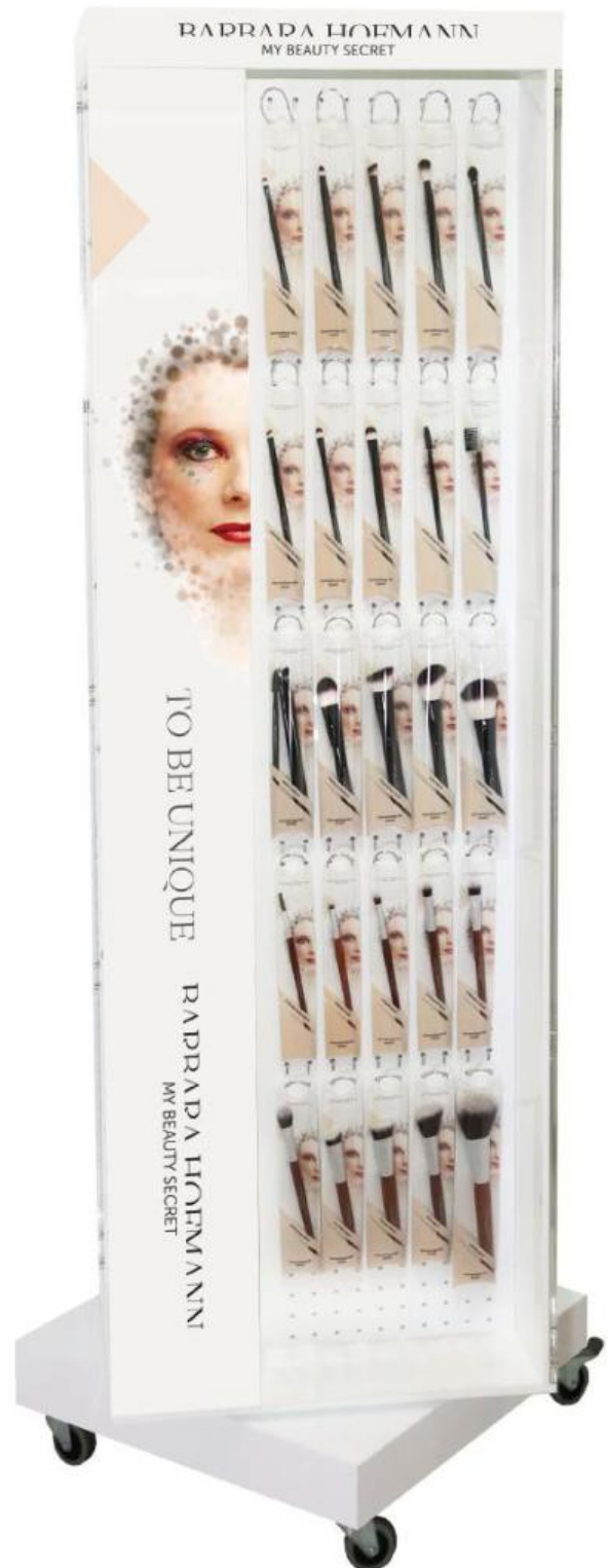
Tower Bodendisplay, Acryl, weiß, vierseitig, drehbar, auf Rollen. Tower floor display, acrylic, white, four sided, rotatable, on rolls. Présentoir de sol "tour", en acrylique, blanc, à quatre faces, pivotant, sur roues.