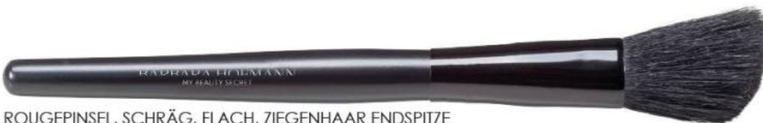
ROUGEPINSEL, SCHRÄG, FLACH, ZIEGENHAAR ENDSPITZE BLUSH BRUSH, ANGULAR, FLAT, GOAT HAIR TIPS PINCEAU BLUSH, OBLIQUE, PLAT, POILS DE CHÈVRE AVEC POINTES FINES Art.-Nr / No: 0132270 Größe / Size / Dimensions: ca. 19 cm EP / PP / PA: € 3,35