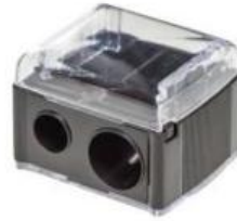
KOSMETIKSTIFT-SPITZER, DOPPELT, MIT SPANFANG COSMETIC PENCIL SHARPENER, DOUBLE, WITH SHAVINGS BIN TAILLE-CRAYON, DOUBLE, AVEC RÉCIPIENT Art.-Nr / No: 1201020 EP / PP / PA: € 1,35