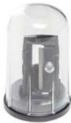
KOSMETIKSTIFT-SPITZER, MIT SPANFANG COSMETIC PENCIL SHARPENER, WITH SHAVINGS BIN TAILLE-CRAYON, AVEC RÉCIPIENT Art.-Nr / No: 1200020 EP / PP / PA: € 1,00